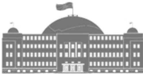
СОБРАНИЕ НА РЕПУБЛИКА МАКЕДОНИЈА